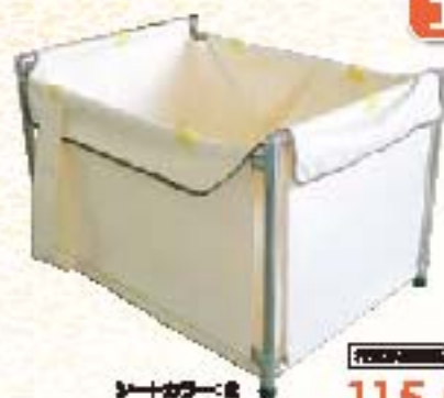
シートカラー：白 115,500円